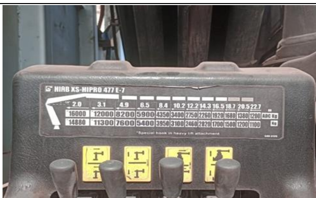
Foto 5. Tabla de Carga