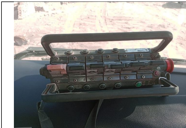
Foto 9. Control