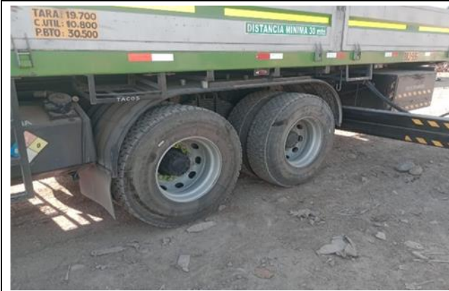
Foto 7. Inspeccion de Neumáticos