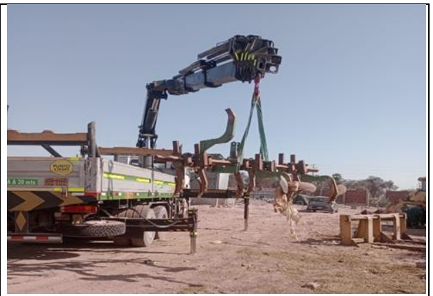
Foto 10. Prueba de Carga

Huaycho Servicios Industriales / www.huaycho.com