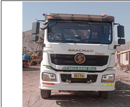
Foto 1. Vista Frontal