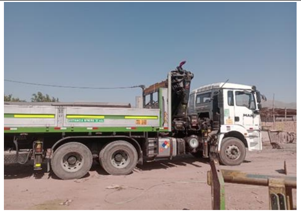
Foto2. Vista Lateral