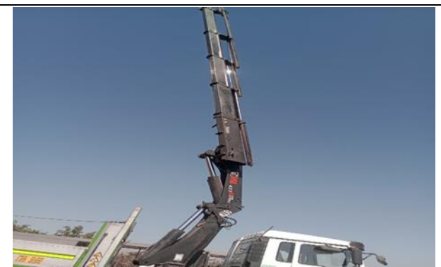
Foto 6. Extensión de Pluma

Huaycho Servicios Industriales / www.huaycho.com