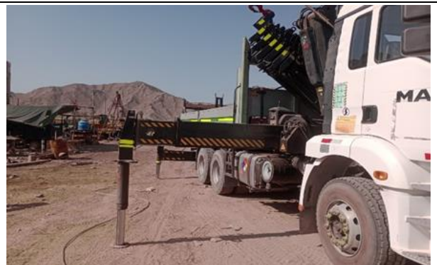
Foto 4. Estabilizadores