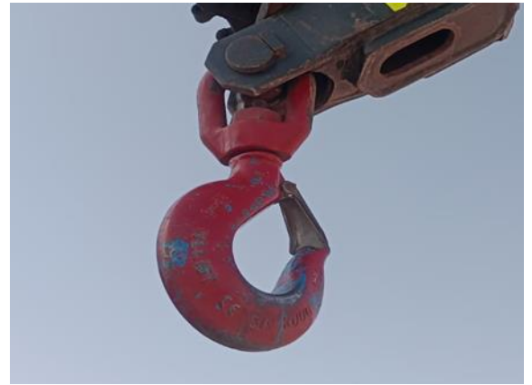
Foto 8. Gancho