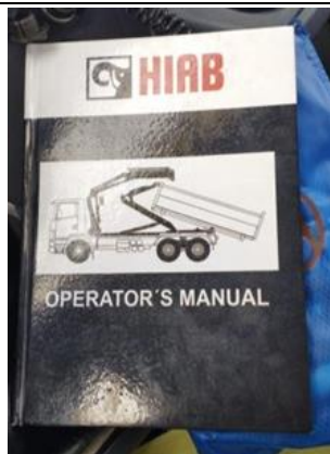
Foto 3. Manual de Operación